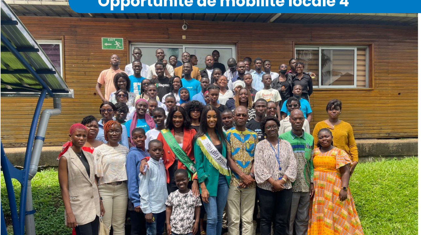
Participation à l'atelier pre-test de « À l'assaut du SIDA » initié par ONUSIDA

Le Programme National de Lutte contre le Sida (PNLS), avec l'appui technique et financier de l'ONUSIDA a mis en place la plateforme ludique dénommée « À l'assaut du SIDA » via le numérique qui est une plateforme de type quiz qui permet de tester et d'enrichir les connaissances sur le VIH/SIDA en vue d'atteindre les objectifs de prévention du PSN d'ici fin 2025.